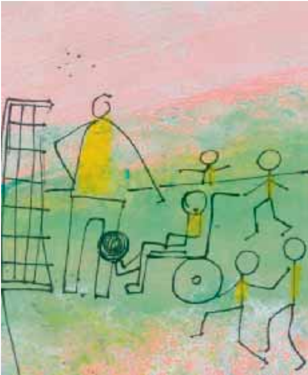
Siegl!? die Bürgersteige in meinem Wohngebiet sind abgesenkt worden.