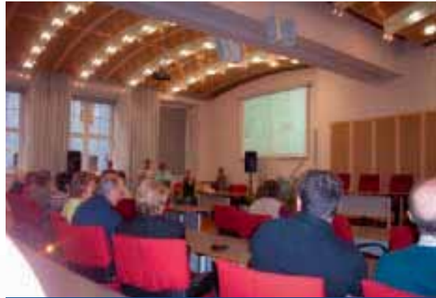
Festveranstaltung zum EJMB 2008

GALA zum EJMB 2003: Das EJMB 2003 war für die Behindertenbewegung des Landes von großer Bedeutung. Mit vielen Aktionen, Projekten und Initiativen haben unsere Mitgliedsverbände auf die schwierige Situation von Menschen mit Behinderungen in den Kommunen des Landes hingewiesen und sich kraftvoll für ein Landesbehindertengleichstellungsgesetz stark gemacht. Obwohl wir in einigen Kommunen des Landes auf dem Weg zu einer barrierefreien Kommune sind und sich, bisher 4 Städte im Land, wie die Stadt Neubrandenburg der „Erklärung von Barcelona“ angeschlossen haben, bekommen wir immer noch nicht den nötigen Rückenhalt bei unseren Landespolitikerinnen und – politikern, um die Diskriminierungen im Land durch landesgesetzliche Regelungen zu beseitigen.