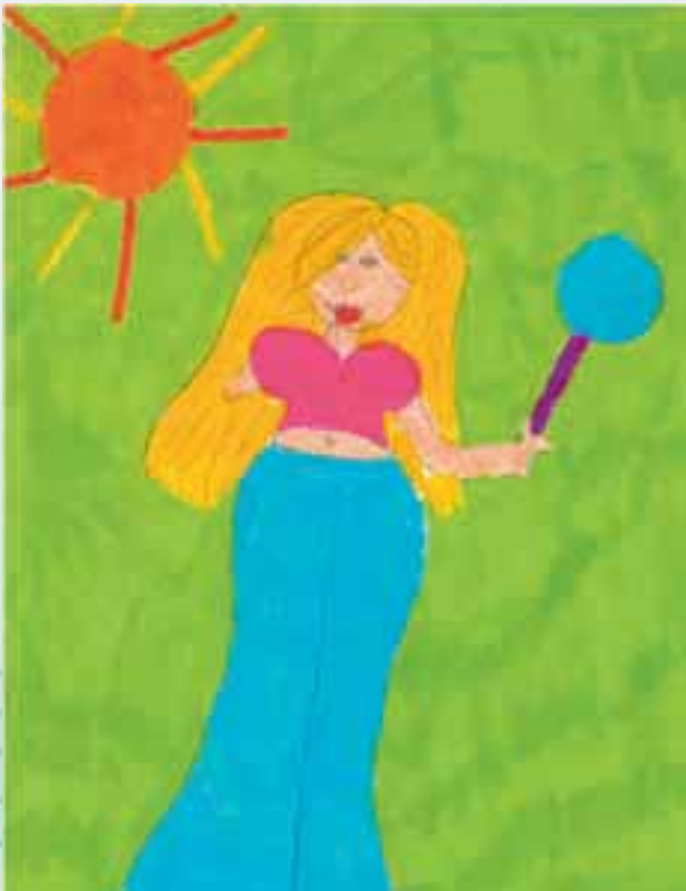
Das ist eine Tennisspielerin mit nur einem Arm.