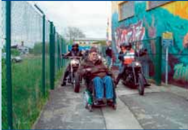
Aktion zum 5. Mai in Güstrow