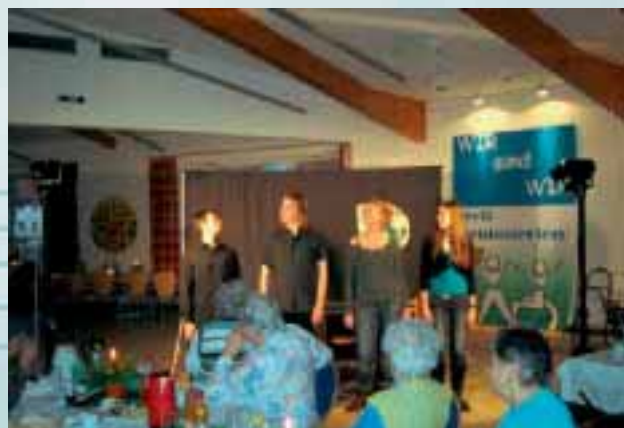
Festveranstaltung zum EJMB 2009