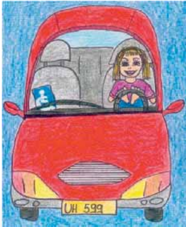
Körperbehinderte Menschen ohne Arme können auch ein Auto mit ihren Füßen fahren. Sie können Taxi-Fahrer sein, oder auch Pizza ausliefern.