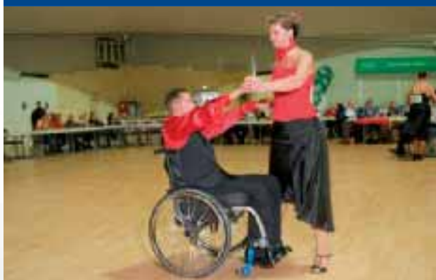
Combitanz Klasse 1