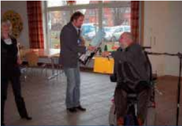
Festveranstaltung zum EJMB 2009

(Vision von Friedensreich Hundertwasser )