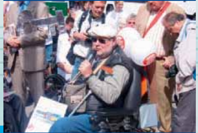
Aktion zum 5. Mai in Berlin