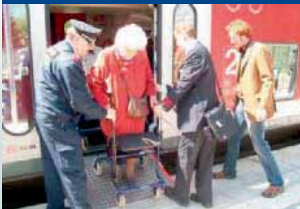
Bahnfahren mit der Deutschen Bahn