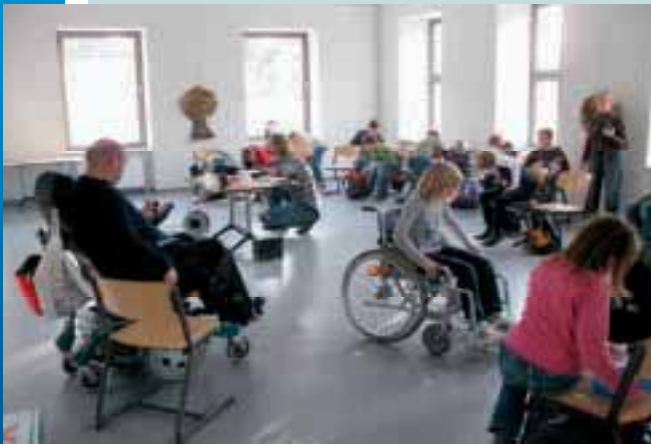
Projekttag an der Grundschule Penzlin