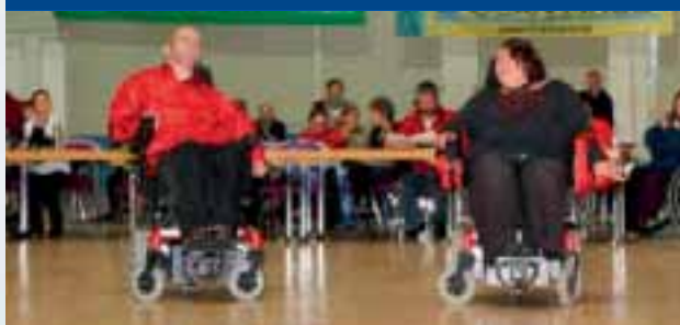
Duotanz Klasse 1

Das jährliche Neubrandenburger Rollstuhltanzfest ist nach wie vor ein Höhepunkt für die Trainings- und Wettkampftaktivitäten vieler Rollstuhltanzgruppen unseres Landes.