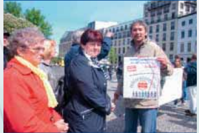
Aktion zum 5. Mai in Berlin