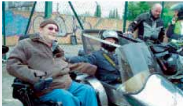
Europäischer Protesttag 2010 in Güstrow

Aktionstag in Güstrow - Biker sind dabei! Eine Rundfahrt durch Güstrow - Bericht: Günther Bischof