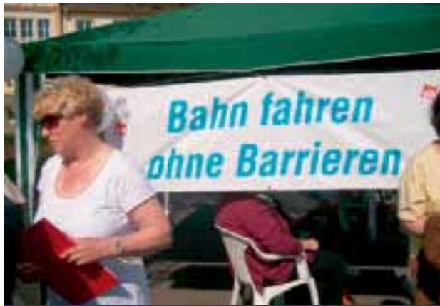
Aktion zum 5. Mai in Neubrandenburg