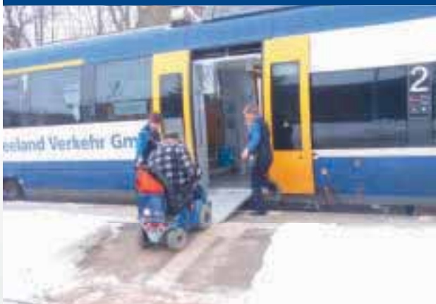
Bahnfahren mit der Olá