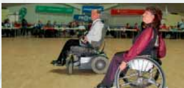
Duotanz Klasse 1

Rollstuhltanz ist eine Sportart für Menschen, die in ihrer Bewegung eingeschränkt sind. Es gibt auch hier verschiedene Tanzarten wie zum Beispiel Standard, Latein oder Freestyle. Es wird im Rollstuhltanz jedoch unterschieden zwischen Kombi-Tanzen (Fußgänger und ein Rollstuhlfahrer tanzen miteinander) und Duo-Tanzen (zwei Rollstuhlfahrer tanzen miteinander).