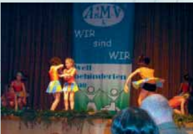
Festveranstaltung zum EJMB 2006

Auf Bundesebene kämpfen wir für ein ziviles Antidiskriminierungsgesetz, damit sich auch Menschen mit Behinderungen gegen jede Form von Diskriminierung zukünftig zur Wehr setzen können.