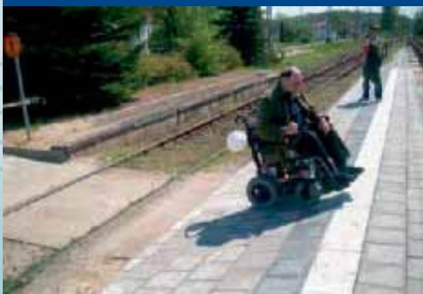
Am Bahnhof Burg Stargard

Zielvereinbarung zur barrierefreien Gestaltung von Fahrzeugen, Haltepunkten und Informationssystemen Zielvereinbarungsverhandlung erfolgreich abgeschlossen und unterzeichnet!