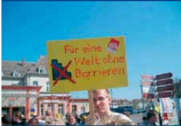
Aktion zum 5. Mai in Neubrandenburg