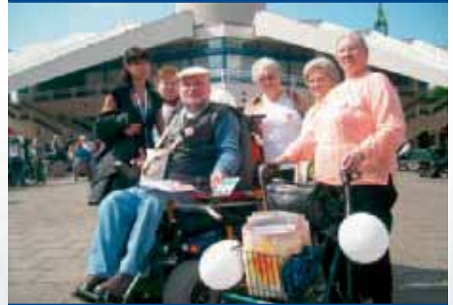
Aktion zum 5. Mai in Berlin