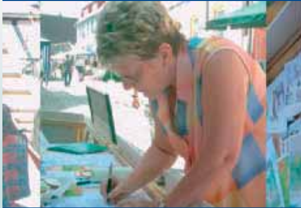
Aktion zum 5. Mai in Burg Stargard