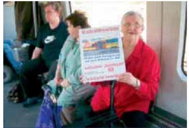
Aktion zum 5. Mai Deutsche Bahn a.G.