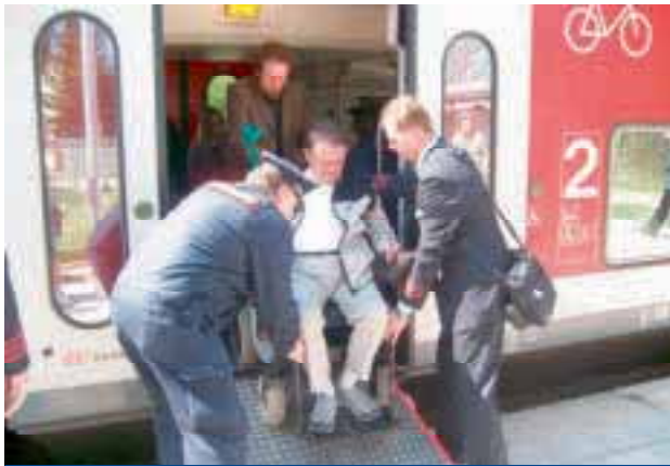
Bahnfahren mit der Deutschen Bahn