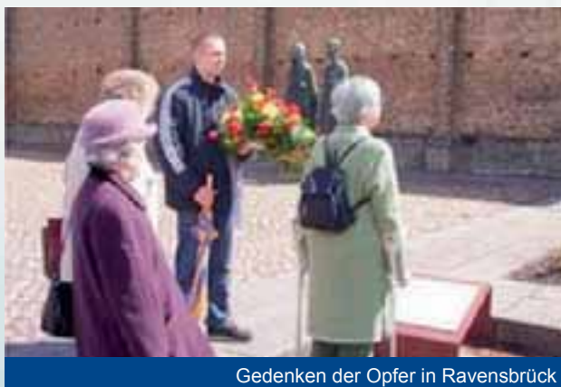
Gedenken der Opfer in Ravensbrück

Auch die Befreiung durch die Alliierten konnte die Schicksale vieler Gefangener in den Konzentrationslagern nicht lindern. Wie wir bei einer Führung durch das Konzentrationslager erfuhren, wurde ein Großteil der in Ravensbrück ermordeten Frauen erst kurz vor Kriegsende Opfer der bestialischen Tötungsmaschinerie. Neben vielen traurigen und erschreckenden Fakten, die wir erfuhren und die uns tief betroffen machten, wurde uns bildlich die "Perversität" der Nationalsozialisten vor Augen geführt. In kleinen Häuschen und scheinbar ungetrübter Idylle lebten die SS-Offiziere und KZ- Aufseher mit ihren Familien, nur durch eine Mauer von dem Ort getrennt, an dem sie täglich Menschen, größtenteils Frauen und Kinder folterten und töteten. Nach der Führung legten wir ein Blumengebinde an der "Straße der Nationen" nieder, die als Mahnmal für uns alle errichtet wurde und gedachten der Opfer. Mit starken Gefühlen der Betroffenheit und Verantwortung für die Zukunft sowie des Gedenkens verliehen wir damit unserer Trauer Ausdruck. Die heute lebenden Generationen tragen die Verantwortung, dass Derartiges nie wieder geschieht und geschehene Verbrechen nicht in Vergessenheit geraten.