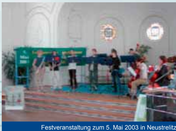
Festveranstaltung zum 5. Mai 2003 in Neustrelitz