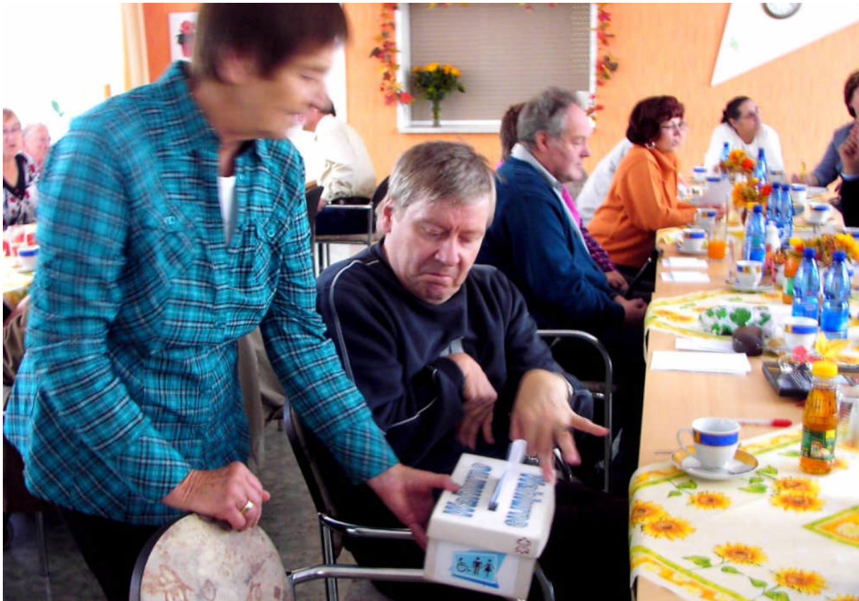
Mitglieder bei der Stimmabgabe